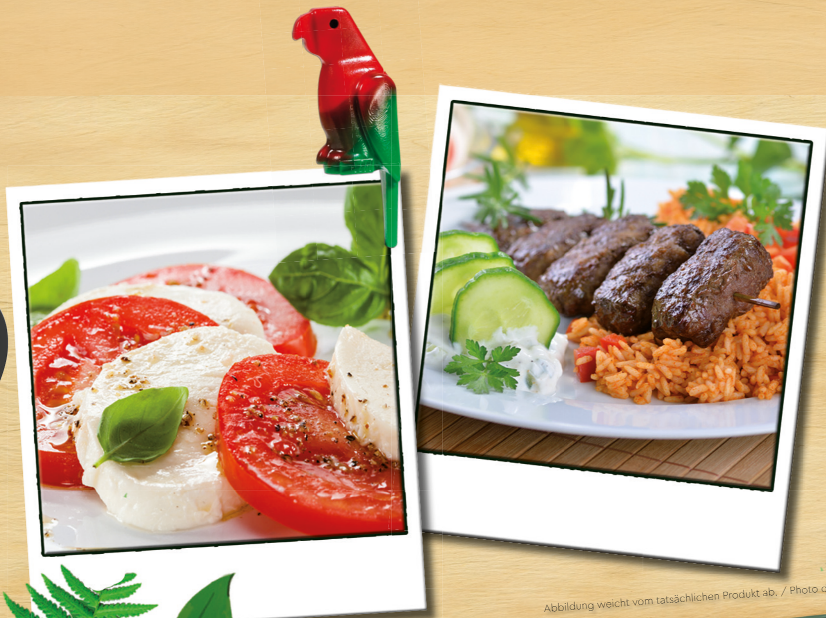
Abbildung weicht vom tatsächlichen Produkt ab. / Photo deviates from actual product.

Chicken nuggets with LEGO® fries, „Spätzle“ (bavarian pasta) with cream sauce, apple rings with vanilla sauce, mini sausages with mashed potatoes, Jungle Jelly 1