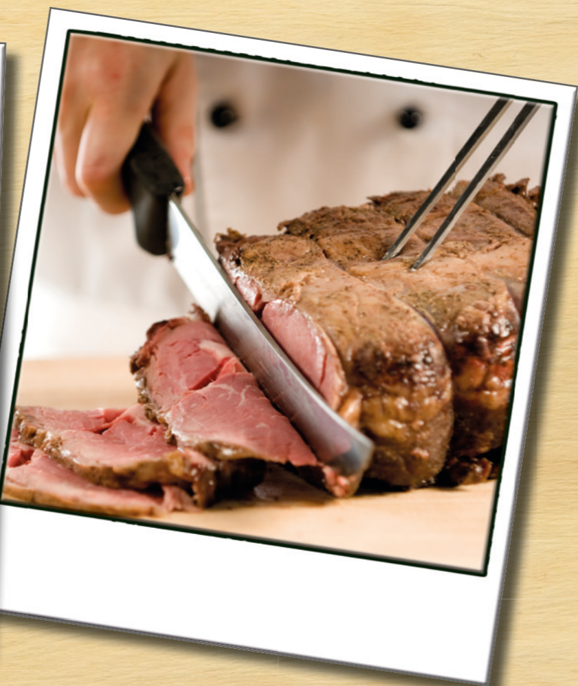
Abbildung weicht vom tatsächlichen Produkt ab. / Photo deviates from actual product.