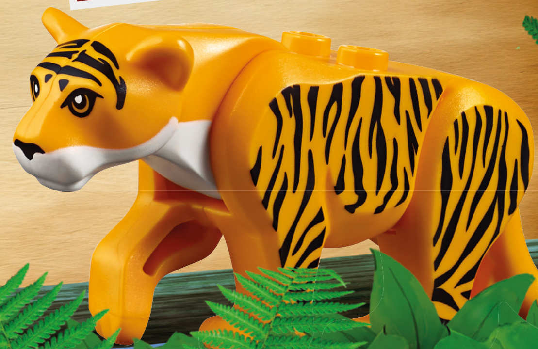
Abbildung weicht vom tatsächlichen Produkt ab. / Photo deviates from actual product.

UNSER FAMILIEN BUFFET AM MONTAG UND FREITAG! OUR FAMILY BUFFET EACH MONDAY AND FRIDAY!